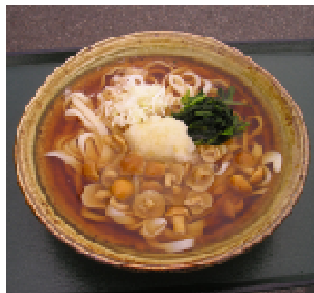
なめこおろしうどん