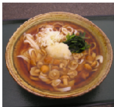
なめこおろしうどん