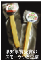
県知事賞受賞の スモークつと豆腐