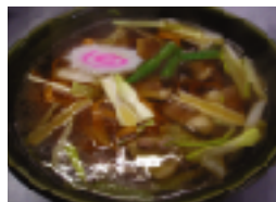
かもなんうどん 600円