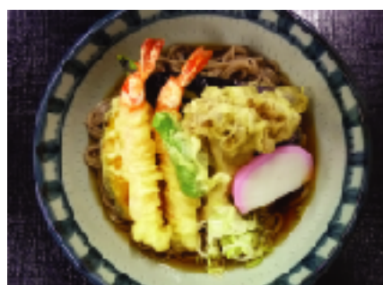
天そば・うどん 1人前 700円