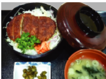
ソースかつ丼 1人前 700円