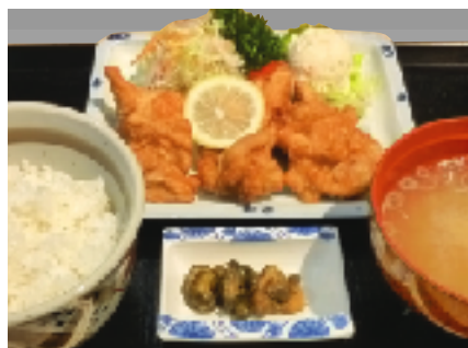
から揚げ定食 1人前 700円