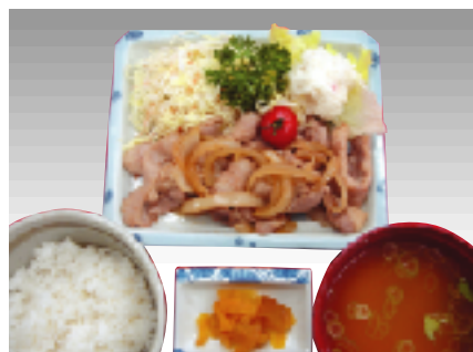
しょうが焼定食 1人前 700円

サラダラーメン (和風胡麻だれ) 1人前 650円 うどん・そばに変更もできます