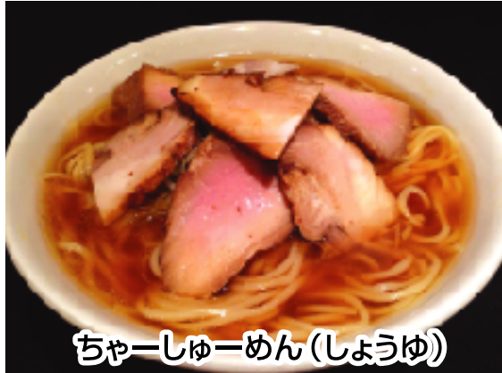
チャーシューめん(しょうゆ)