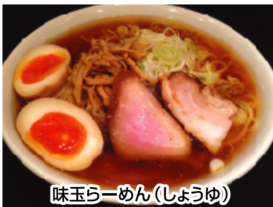
味玉らーめん(しょうゆ)

ラーメン雑誌やTV等でも紹介された人気の店。麺は3種類の国産小麦に全粒粉を自家ブレンドし、栄養面や小麦の香りにこだわった自家製麺(手もみちぢれ麺)に、丸鶏・カツオ節・煮干しの風味が漂う自家製無化調スープ。豚バラ肉とモモ肉の2種類を使用した自家製チャーシューなど手間を惜しまず素材と味を追求する本格らーめんを当館だけの特別PR価格でご提供いたします。