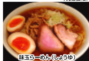
味玉らーめん(しょうゆ)