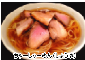
ちゃーしゅーめん(しょうゆ)