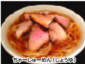
ちゃーしゅーめん(しょうゆ)

各種大盛り(1.5人前) 100円増し 営業時間 11:00~16:00 スープがなくなり次第終了