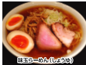
味玉らーめん(しょうゆ)