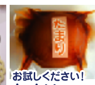
お試しください! たまりオニオン