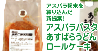
南会津産の大豆使用 あやこがね味噌