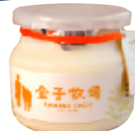
ジャージー乳の濃厚な味わい ゴールデンヨーグルト