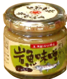
農林水産省大臣賞受賞 岩魚味噌