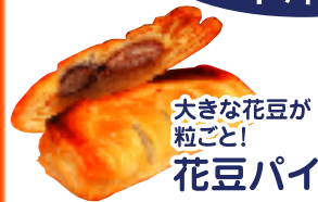
大きな花豆が粒ごと! 花豆パイ