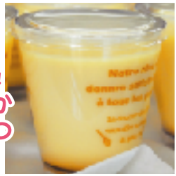
毎回大好評!! なめらかはちみつプリン