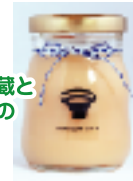
地元酒蔵と菓子店のコラボ! 酒粕生キャラメル