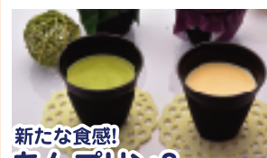
新たな食感! あんプリン& 抹茶あんプリン