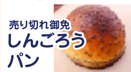
売り切れ御免 しんごろうパン