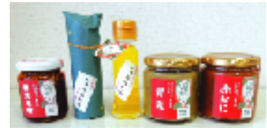
只見の味覚シリーズ 只者じゃないブランド