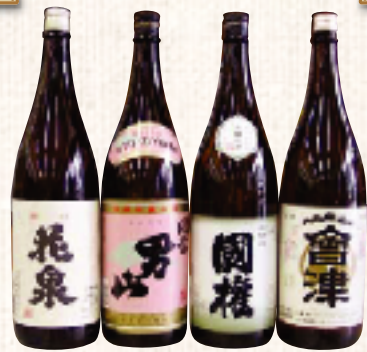
花泉 開當男山 國権 金紋会津