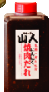
山の幸を凝縮 山人焼肉のタレ