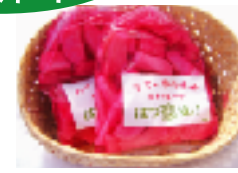
季節限定! 籠岩の赤かぶ はつ恋漬け