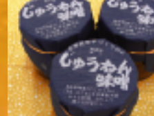
じゅうねん味噌(下郷町)