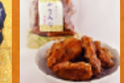
じゅうねんかりんとう(只見町)