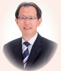
福島県知事 内堀 雅雄