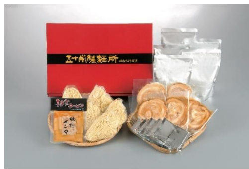
五十嵐製麺（喜多方市）