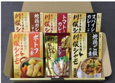
川俣町農業振興公社（川俣町）