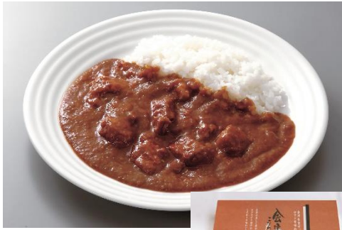
会津地鶏ネット (会津若松市)