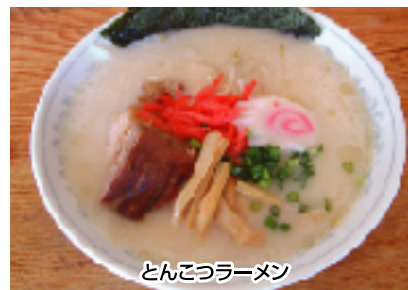
とんこつラーメン

● とんこつラーメン じっくりと煮込んだとんこつスープに、豚の角煮が入っています。よしだ屋の自信の新メニューです。 1杯 650円