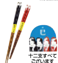
十二支すべて ございます