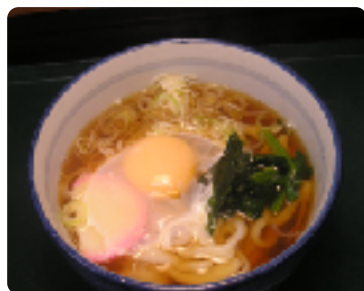
月見うどん 1杯 450円