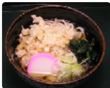
たぬきうどん 1杯 400円