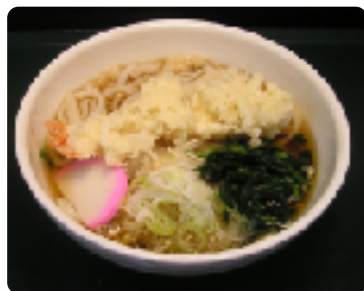
海老天うどん 1杯 600円