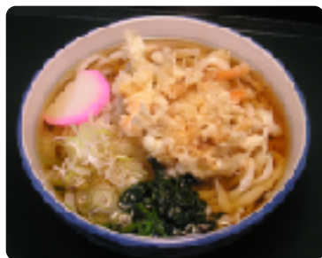
かき揚げうどん 1杯 500円