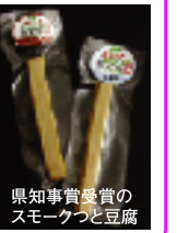
県知事賞受賞のスモークつと豆腐