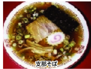
屋台ラーメン ● ラーメン(醤油味) 麺は細ちぢれ麺、スープは飽きのこない和風だしです。

煮干しの香りがふわりと漂うラーメンは、和風だしのスープと、自家製の極細ちぢれ麺の昔なつかしい屋台ラーメンの味です。今回から、新メニューのとんこつラーメンが登場です。(準備したスープがなくなり次第終了することがあります) (税込価格)