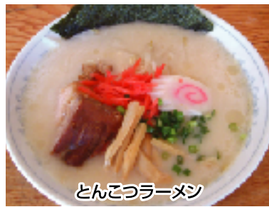
● とんこつラーメン じっくりと煮込んだとんこつスープに、豚の角煮が入っています。よしだ屋の自信の新メニューです。