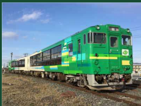
風っこふくしまハーベスト号 外観（イメージ）