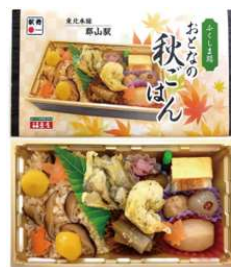
ふくしま路おとなの秋ごはん