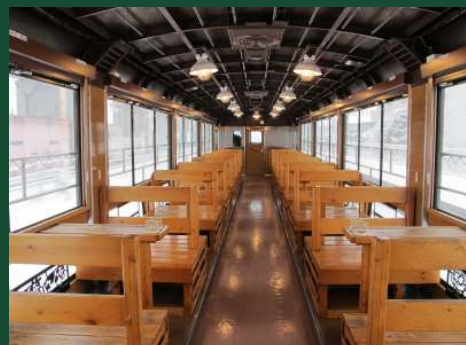
風っこふくしまハーベスト号 車内（イメージ）