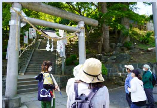
実際のツアーの様子