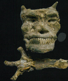
鬼のミイラ