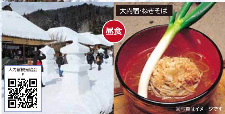
大内宿・ねぎそば

鶴ヶ城の「鉄門」「南走長屋」「干飯櫓内」にて「デジタルアートミュージアム・鶴ヶ城 光の歴史絵巻」もあわせてご覧いただけます。