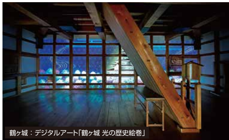
鶴ヶ城：デジタルアート「鶴ヶ城 光の歴史絵巻」

難攻不落の名城とうたわれ、戊辰戦役で新政府軍の猛攻をしのいだ鶴ヶ城。昭和40年9月に再建され、平成23年春には幕末時代の瓦(赤瓦)をまとった日本で唯一の天守閣となりました。