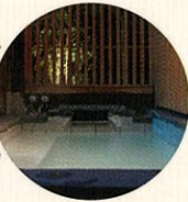
お好きな旅館で温泉を満喫