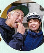
天ぶら饅頭を味わう