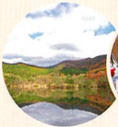
姫沼でリフレッシュ

このツアーでしか行けない猪苗代の秘境、「姫沼」で日常から離れてウェルネスな時間を過ごすことで、心と身体が癒やされます。自然の中のヨガ体験で体と心を整え、チェアリングをし、自分と見つめ合う時間を提供します。心身整った体を、単一の湧出口からの湧出量が日本一と言われている中ノ沢温泉でリフレッシュできます。