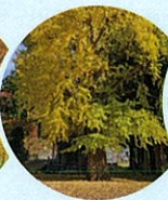
おすすめスポットをご案内