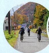
猪苗代の集落をサイクリング

かつて沼尻鉱山の硫黄を運ぶことを目的に運行していた沼尻軽便鉄道跡地を通りながら猪苗代町の景色、魅力を楽しめるサイクリングコースです。田舎道を颯爽とサイクリングをし、「こんなところに、こんなところが!」等、様々な発見があります! 磐梯山が一望できるロングサイクリングをして普段気づかない猪苗代の魅力を見つけて見ませんか!