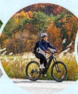
田園風景をサイクリング