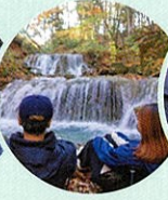
坊主ヶ滝でチェアリング