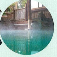
お好きな旅館で温泉を満喫

このツアーでしか行けない猪苗代の秘境、「姫沼」で日常から離れてウェルネスな時間を過ごすことで、心と身体が癒やされます。自然の中のヨガ体験で体と心を整え、チェアリングをし、自分と見つめ合う時間を提供します。心身整った体を、単一の湧出口からの湧出量が日本一と言われている中ノ沢温泉でリフレッシュできます。