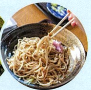
名物のそばランチ