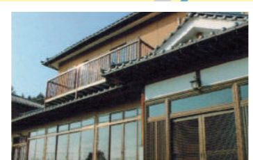
農家民宿 森のふるさと