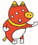
福島を応援する「ペコ太郎」

福島県では、東日本大震災から13年以上が経過する中で、 福島県の復興の状況 をより多くの方に知っていただけるよう、 復興に関する10の疑問 を、図や写真でわかりやすくまとめた資料を作成しています。